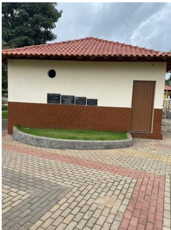
FOTO ÁREA DA PRAÇA