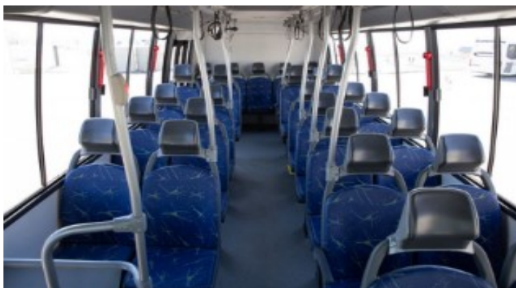
Poltronas injetadas tipo urbano com encosto e assento almofadadas

as Poltronas tipo Lotação que são atendidas com as devidas normas brasileiras vigentes, além da poltrona do dispositivo (DPM) ser diferente ainda temos as poltronas preferencial que não podem ser da forma que está sendo solicitado pelo fato de exigir cinto de segurança de três pontos e colete torácico de quatro pontos e cinto frontal.