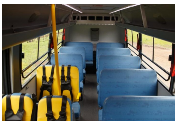
Cinto de segurança de três pontos e colete torácico de quatro pontos frontal.

Desta forma, podemos atender a necessidade do órgão com as seguintes alterações, onde nada prejudicaria o certame, bem como traria a ampla participação do maior número de fornecedores.