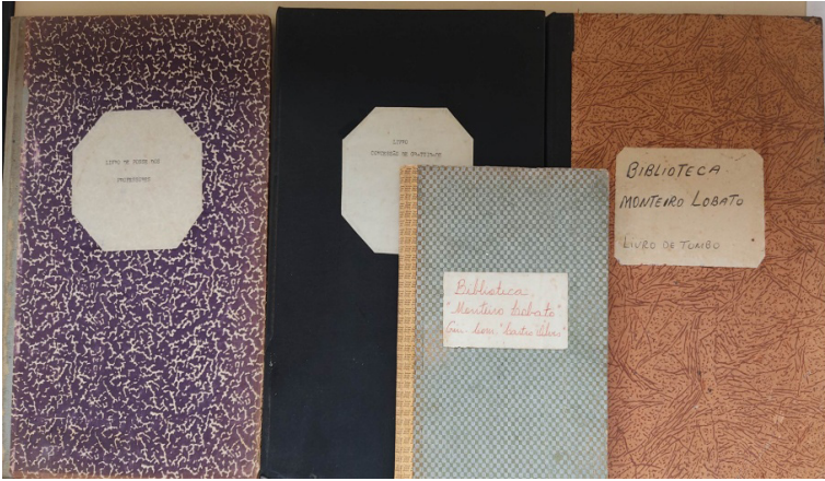
Foto 04: Alguns documentos referentes ao Ginásio Castro Alves, como Ata de Posse de Professores, Livro de Gratuidade e Livros de Registro da Biblioteca Monteiro Lobato, do estabelecimento educacional.