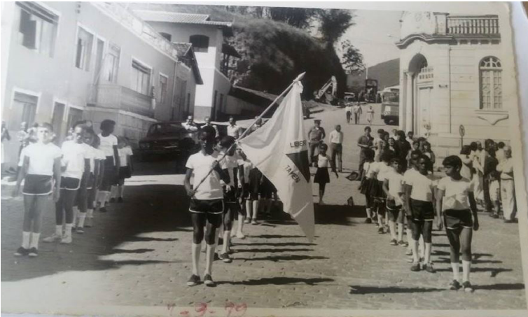
Foto 15: Outro recorte do desfile cívico de 1979 com a escola e a Prefeitura Municipal ao fundo.