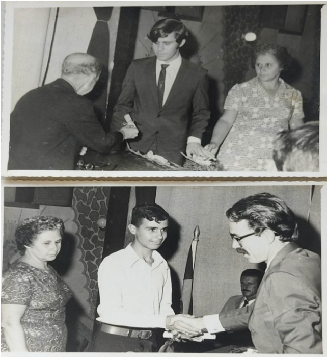
Foto 07: Cerimônia de formatura de alunos do Castro Alves no Teatro Municipal.