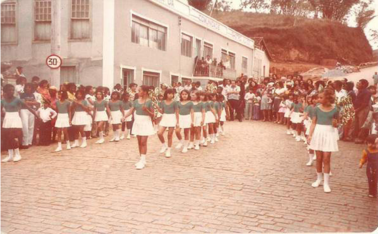
Foto 14: Visão privilegiada de um desfile cívico de 1979, com destaque do prédio do Ginásio Castro Alves em boa condição estrutural.