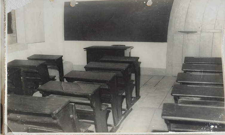
Foto 12: Interior de uma das salas de aula da Escola Castro Alves em data ignorada.