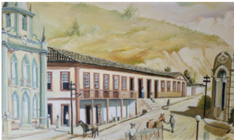
Foto 02: Uma pintura de Pedro Benedito Bento, representando a paisagem urbana simples de nossa cidade. O velho casarão aparece logo acima da Igreja Matriz do Divino Espírito Santo.