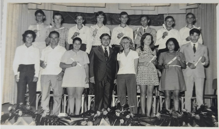
Foto 08: Alunos do Castro Alves com o diploma em mãos, no Teatro Municipal.