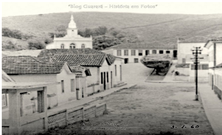
Foto 03: Essa bela fotografia contida no blog Guarará - História em Fotos - é possível observar a partir da porta da Biblioteca Municipal, em 1960, ao lado direito da Igreja Matriz, o casarão com suas majestosas portas e janelas de madeira.