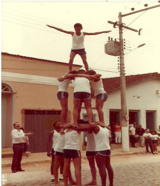
Foto 19: Pirâmide humana com alunos do Ginásio Castro Alves, em 1984, em seu último ano de existência.