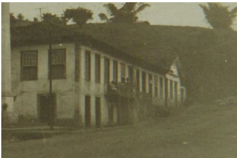
Foto 01: Um raro registro fotográfico da década de 1920, do imóvel onde funcionou o Ginásio Comercial Castro Alves. Na ocasião o local ainda funcionava como moradia e ponto comercial.

Apresentamos um breve cronograma fotográfico com algumas valiosas imagens do imóvel onde funcionou o Ginásio Comercial Castro Alves. Esses registros contemplam festividades cívicas que tiveram a participação de seus alunos e corpo docente. Infelizmente, ao longo da pesquisa, encontramos poucos documentos relacionados à cronologia de funcionamento do colégio que publicamos na sequência.