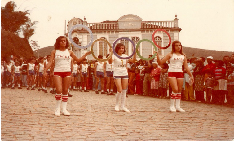
Foto 16: Nesta imagem é possível identificar a presença de alunos do Ginásio Castro Alves com a ilustração CENEC nas camisetas das estudantes no desfile de 1979.