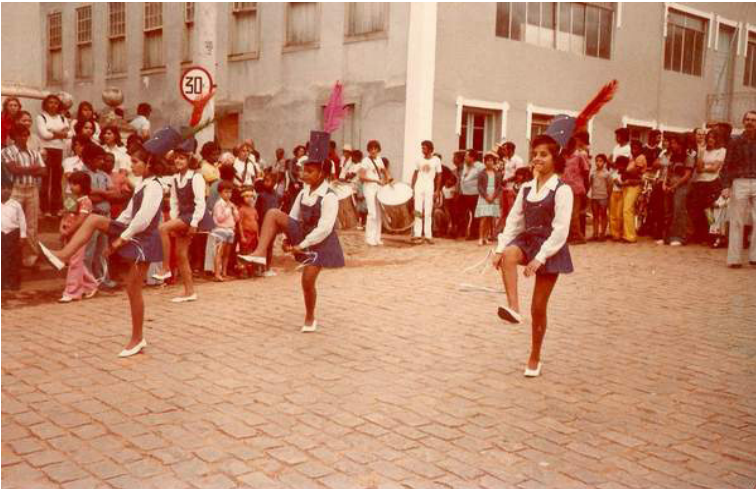
Foto 13: Desfile cívico passando em frente ao Ginásio Comercial Castro Alves em 1979. Observem que as janelas laterais ainda permaneciam de madeira para a Rua Luiz Vianna.