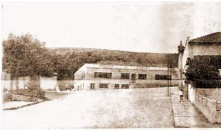
Foto 05: Raro recorte fotográfico sem data com o casarão já adaptado para o funcionamento do Ginásio Comercial Castro Alves. As portas e janelas de madeira na parte frontal foram substituídas por esquadrias de ferro e vidro transparente.