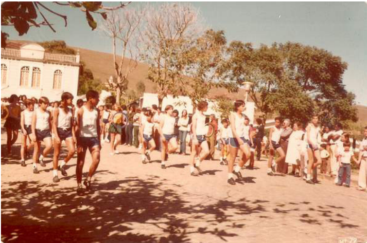
Foto 17: Desfile Cívico de 1979, com os alunos do Ginásio Castro Alves em destaque.